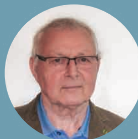
Klaus Hofstetter Bürgermeister